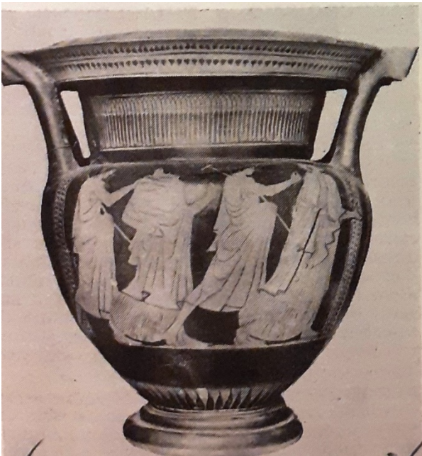
Le Pleiadi raffigurate su un antico cratere

Questi scrittori e poeti trassero il loro nome dalla costellazione delle Pleiadi, il gruppo di sette stelle che prende il nome dalle mitiche figlie di Atlante.